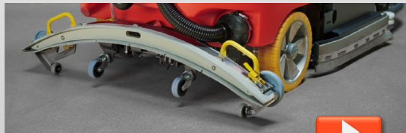
video sostituzione gomme tergi