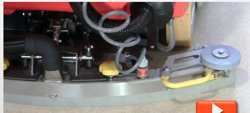
video pulizia di fondo tergi